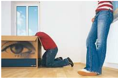
Umzugskostenpauschale in WEG möglich

Eine WEG kann eine Umzugskostenpauschale beschließen. Diese darf aber nicht unangemessen hoch sein und zu einer Ungleichbehandlung der Wohnungseigentümer führen.